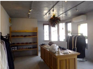
手作りの靴や雑貨、セレクトした洋服が並ぶ隠れ家的なお店です。