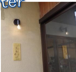
特注の銅板製の看板がお出迎え