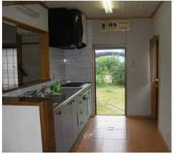
食洗機と乾燥庫をつけて 使い勝手UP!