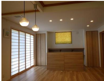
広いリビングに 子供達の専用スペース