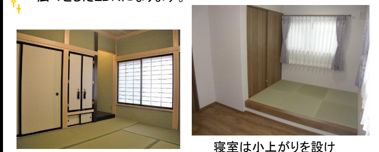
寝室は小上がりを設け 布団を敷けるようにしました。