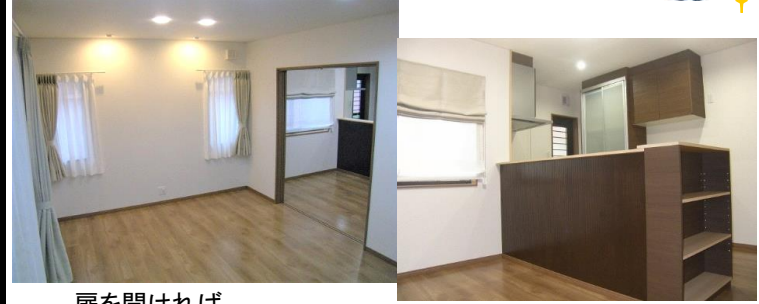
扉を開ければ 広々としたLDKになります。