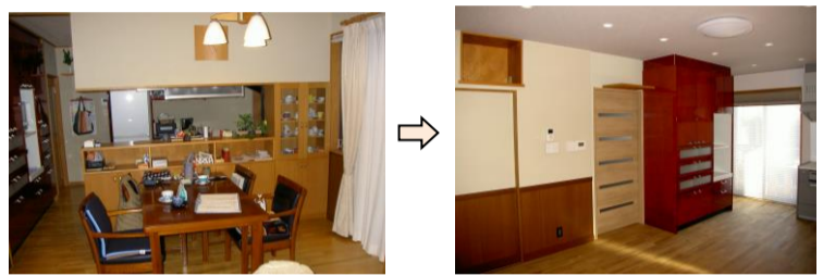
②対面キッチンだった部分に壁を増設し、二部屋に分けました。