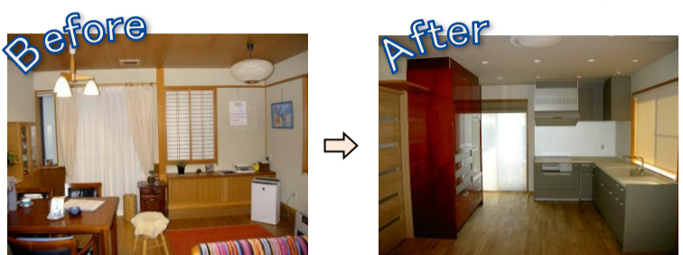
①ダイニングがキッチンに☆ 素敵な既存のシステム収納は、そのまま移設しました。