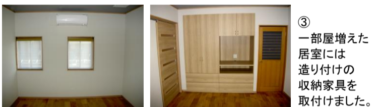
③ 一部屋増えた居室には造り付けの収納家具を取付けました。

6・7月度は新築2件、住宅内装・外装のリニューアル工事が9件、加賀・小松方面で工事をさせていただきました。ご近所のみならずには工事中ご迷惑をおかけしました。ご協力ありがとうございました。