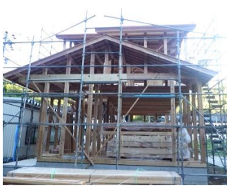
沢山の木工さんで 一気に建てていきました！