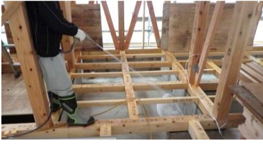
防蟻作業中 白蟻は 寄せ付けないぞ！