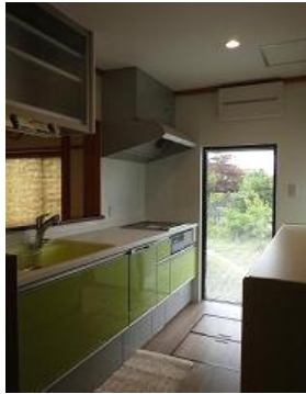
食洗機と乾燥庫をつけて 使い勝手UP!