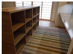
広いリビングに 子供達の専用スペース