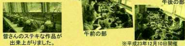
皆さんのステキな作品が出来上がりました。