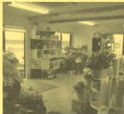
自社生産の花苗が沢山並ぶ フラワーショップ『花の〜と』

5月度は新築3件、住宅内装・外装のリニューアル工事が 4件、加賀・小松・福井方面で工事をさせていただきました。 ご近所のみなさまには工事中ご迷惑をおかけしました。 ご協力ありがとうございました。