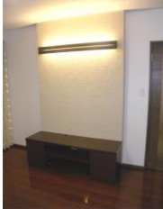
間接照明付きでテレビものんびりと