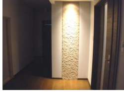
お客様を迎えるエントランスホール