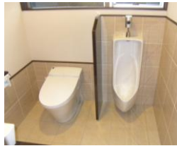
明るく元気な男の子の為に小便器を設置

11・12月度は新築4件、住宅内装・外装のリニューアル工事が5件、加賀・小松・福井方面で工事をさせて頂きました。ご近所のみならずには工事中ご迷惑をおかけしました。ご協力ありがとうございました。