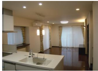
明るく広々としたリビング